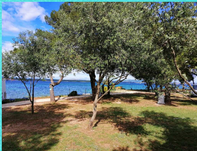
Unser Standplatz am Campingplatz