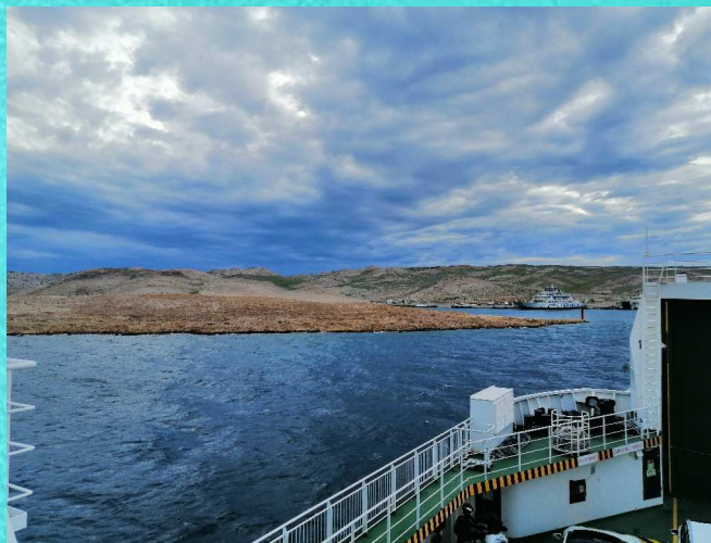
Insel Rab vom Fährhafen aus