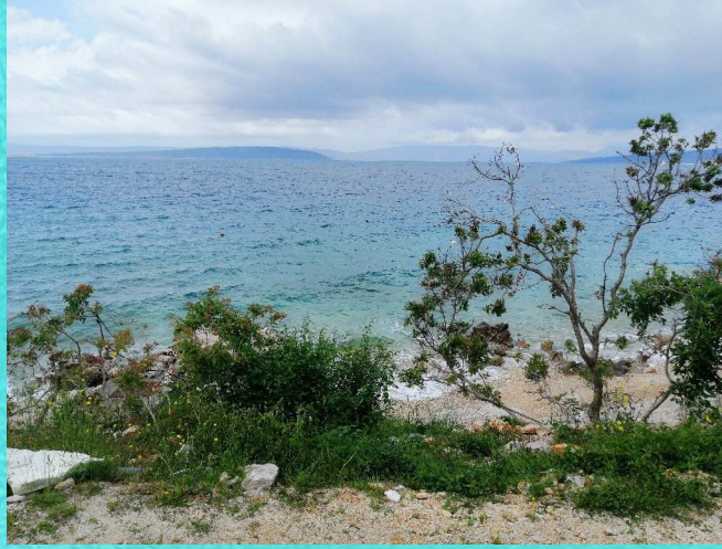
Standplatz auf Krk