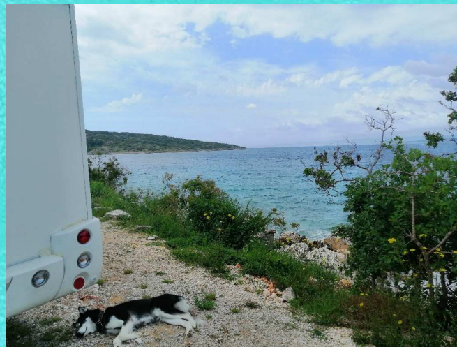
Standplatz auf Krk

Um 5 Uhr früh reißt uns der Wecker aus dem Schlaf, denn um 6 Uhr geht die Fähre und vorher heißt es noch Ticket besorgen und Leia ausführen. 5:45 Uhr rollen wir dann drauf und Punkt 6 Uhr geht es auch schon los. Nun ist erst mal wieder 1 1/2 Stunden Zeit und wir nutzen diese für ein gemütliches Frühstück im WoMo. Das Wetter ist leider auch heute nicht wirklich berauschend. So entscheiden wir uns auf Krk wieder einen Campingplatz anzufahren und erst mal abzuwarten wie es sich nun weiter entwickelt. Das WoMo muß nach all den Tagen auch mal wieder gereinigt werden und dass bietet sich dann heute ja ganz gut an. Da aufgrund der Krise hier trotz der Pfingsferien noch alles recht leer ist, haben wir auch wieder einen schönen Standplatz in erster Meerlinie bekommen und können so wenigstens die Aussicht und das Meeresrauschen genießen.