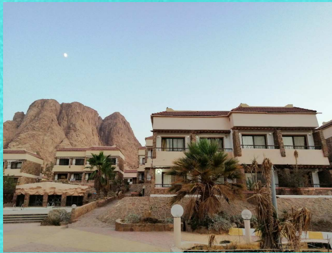
Unsere Hotel in St. Catherine