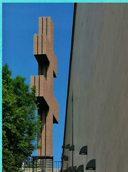
Crux Lorraine am Charles de Gaulle Monument

Erneut ein wunderschöner Tag und wir beginnen diesen Heute mit Hefezopf und Honig. Bei strahlendem Sonnenschein führt uns der heutige Weg über Troyes und dem Parc naturel de la Forêt Orient durch die Champagne. Beim Charles de Gaulle Monument machen wir Mittagspause und dann geht es weiter über Chaumont und durch die Vogesen nach Saint-Louis. Hier wird noch einmal getankt und die weitere Route geplant. Wir beschließen oberhalb von Mulhouse auf einen Campingplatz zu fahren und ziehen los. Dort angekommen erklärt man uns das dieser für Nichtmitglieder erst ab Juni geöffnet hat, also wieder einen Standplatz in der freien Natur. Diesen finden wir nach ein bisschen suchen an einem Bach im Gewerbegebiet in Mulhouse.