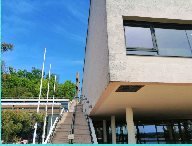
Charles de Gaulle Monument