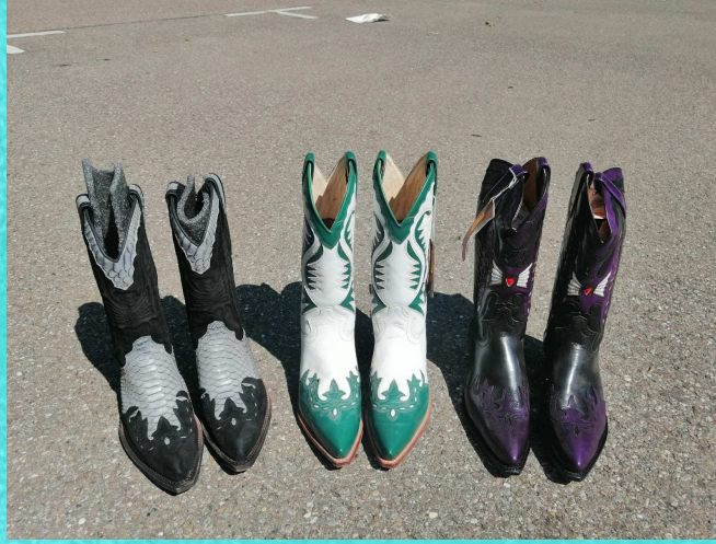
Zuwachs der Stiefelsammlung