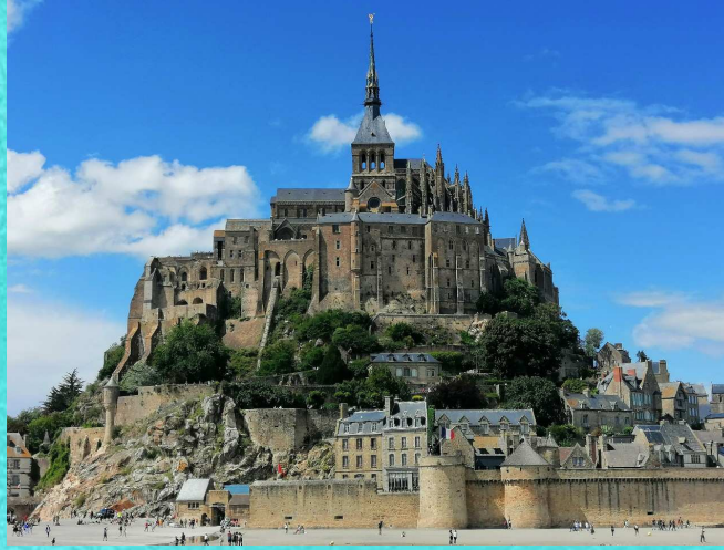
Mont - Saint Michel