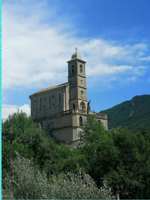
Felsenkirche auf dem Weg nach Susa